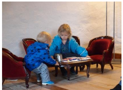
Im Schloss königliche Kindersessel ausprobieren

Bei Gelegenheit wird ein Dom oder ein Münster angeschaut, mit Glockenturm, bunten Glasfenstern, Krypta, Kreuzgang und alten Grabplatten. Im Sommer sind Ausflüge in eine Einsiedelei oder eine Höhle genau das Richtige. Kinder lieben auch Römische Ausgrabungsstätten, Mosaik und Amphitheater. Wenn so etwas in der Nähe existiert, auf zur Entdeckungsreise in die römische Vergangenheit. ●