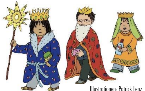
Illustrationen: Patrick Lenz (aus «Spielen, Bewegen, Selbermachen»)

Kinder erleben durch Traditionen und Feste im Jahreslauf die vier Jahreszeiten kennen. Zu einem Fest gehört bestimmtes Essen, Lieder, Verse, Spiele, Geschenke, Musik und Tanz. Familientraditionen geben den Kindern Glücksgefühle und Sicherheit. So auch die Vorfreude über Weihnachtszeit, Samichlaus, Osterzeit mit Eier suchen oder der Nationalfeiertag mit seinen Höhenfeuern und Feuerwerk.