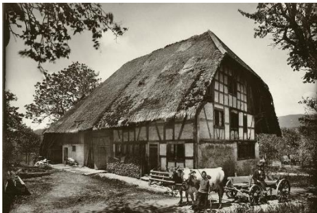
In diesem Haus lebten die Urgrosseltern

Anregungen für Grosseltern und Enkelkinder: An regnerischen Tagen zusammen in alten Fotobüchern schmökern. Finden sich noch Fotos zum Thema: «100 Jahre Familiengeschichte»?