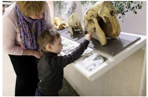
Mit Oma im Museum

Die Grosseltern zeigen den Enkelkindern, wo die Urgrosseltern aufgewachsen sind. Erzählen warum die Urgrossmutter in einem schwarzen Hochzeitskleid geheiratet hat. Berichten was aus Onkeln, Tanten und ihren Kindern geworden ist. Sie betrachten gemeinsam alte Schulfotos und Ferienbilder. Geschichten um Familienstammbaum und Familienwappen sind spannend. An Familiengeschichte interessierte Kinder malen den eigenen Stammbaum. Wie Detektive werden alte Wohnorte von Vorfahren aufgestöbert und besucht. Grosseltern geben Anekdoten und