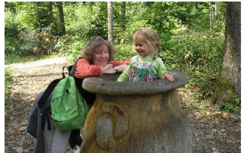
Mit Oma im Märchenwald

Spielen mit Sand und Wasser oder sich schmücken mit Naturmaterial ist sehr beliebt. Auf Bäume klettern oder auf Baumstämmen balancieren ist eine Kunst. Im Wald Mooshäuschen bauen, Märchen hören und spielerisch erleben, sind für Kinder prägende Erfahrungen, die ihnen Grosseltern mit geschenkter Zeit ermöglichen. ●