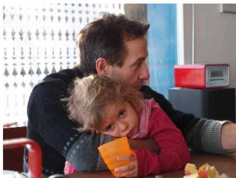
Bei Müdigkeit: Opa schenkt Geborgenheit

Wikipedia hält fest: «Bei einer Untersuchung zum Thema Grosseltern und Enkel in der Schweiz bezeichneten über 90 % der befragten Enkel und Grosseltern die Beziehung untereinander als wichtig. Die Mehrheit der Enkel charakterisierte ihre Grosseltern als liebevoll und grosszügig, eine Minderheit als streng und ungeduldig. Als besonders wertvoll wurde genannt, dass Grosseltern für ihre Enkel da waren, ihnen zuhörten und Zeit für sie hatten. Die Befragung der Enkel ergab, dass für eine lebendige Beziehung eine relativ gute körperliche und psychische Gesundheit der Grosseltern erforderlich ist. Das ist wichtiger als ihr tatsächliches Alter.»