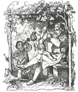
Unsterbliche Klassiker: Knireiterspiele

Was passiert beim Spielen von Versen? Kinder zwischen zwei und acht Jahren lieben den rhythmischen Gesang und den Humor von Versen und Reimen. Beim Klatschen, Patschen und Stampfen bewegen sie alle Muskeln von Kopf bis Fuss. Mit Spielversen erweitern sie ihren Wortschatz, die Freude am Wiederholen und bauen sich Brücken vom «Ich zum Du» auf.