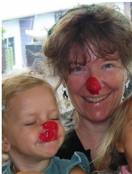
Sich mit Babybel-Käserinde in Clowns verwandeln

Grosseltern erleben im Umgang mit ihren Enkelkindern, dass sie nicht mehr die gleiche Verantwortung wie die Eltern tragen. Sie können sich mehr Zeit lassen und diese geniessen. Sie stehen weniger unter Erziehungsdruck und gehen lockerer mit ihren Enkelkindern um. Durch gemeinsames Tun, Spielen und Lachen vertieft sich ihre Beziehung. Vielen Grosseltern ist dieser unbeschwerte Kontakt mit ihren Enkelkindern das aller Wichtigste.