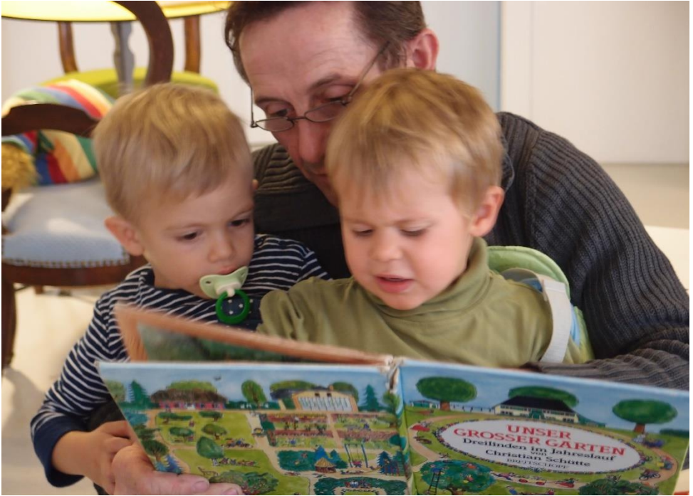
«Büchle» mit Opa