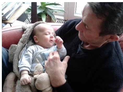
Durch gemeinsames «Sein» entsteht Unvertrauen