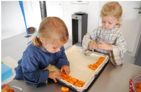
Kinderspiel im Küchenalltag: Küchenhilfen sind willkommen

...Einfallsreichtum und Spontaneität gehören ebenso zum Spielen des Kindes wie das Einhalten bestimmter Ordnungen und Regeln. Individualität und Gemeinschaftlichkeit werden im Spiel beide gefördert. Das spielende Kind ist gleichzeitig tätig und von Erlebnissen erfüllt. Die Trennung zwischen Arbeitszeit und Freizeit ist ihm fremd. Zumeist ist das Spiel des Kindes nicht von einem Ziel bestimmt; auch dort, wo es ein Ziel kennt, sind die Vorgänge beim Spielen ebenso wichtig wie das Ziel selbst.»